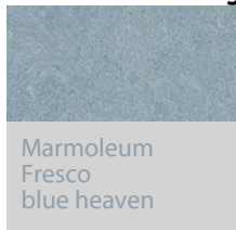
Marmoleum Fresco blue heaven