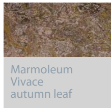
Marmoleum Vivace autumn leaf